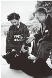
「谷崎潤一郎」 ('文士の時代'より)

11月30日(木)迄 観覧料/一般2000円(600円) 大学生等1000円(800円) ※(1)内は団体(20名以上)